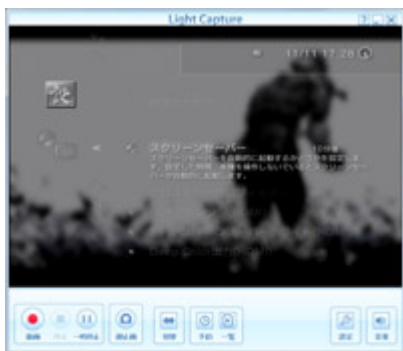
キャプチャーソフトの例