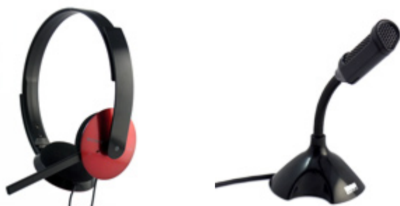
ヘッドセット（左）とスタンドマイク（右）