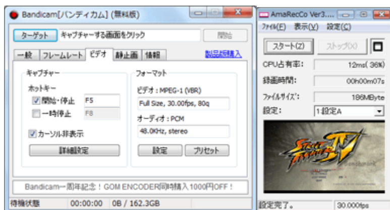
Bandicam (左) とアマレココ (右)